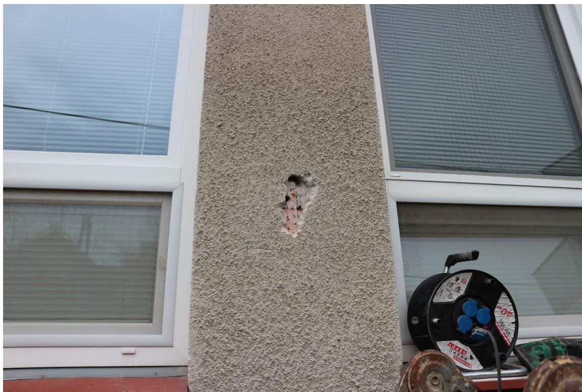
13...meziokenní pilíře z CD IVA