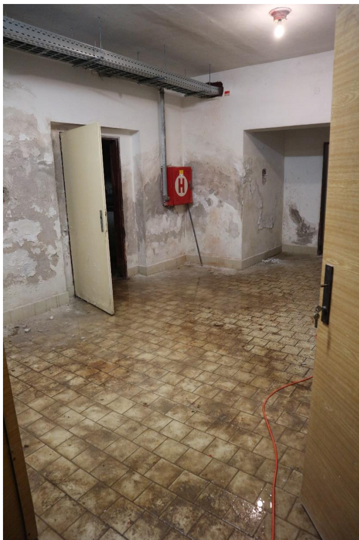
17...interiér 1.PP s vysokou vlhkostí