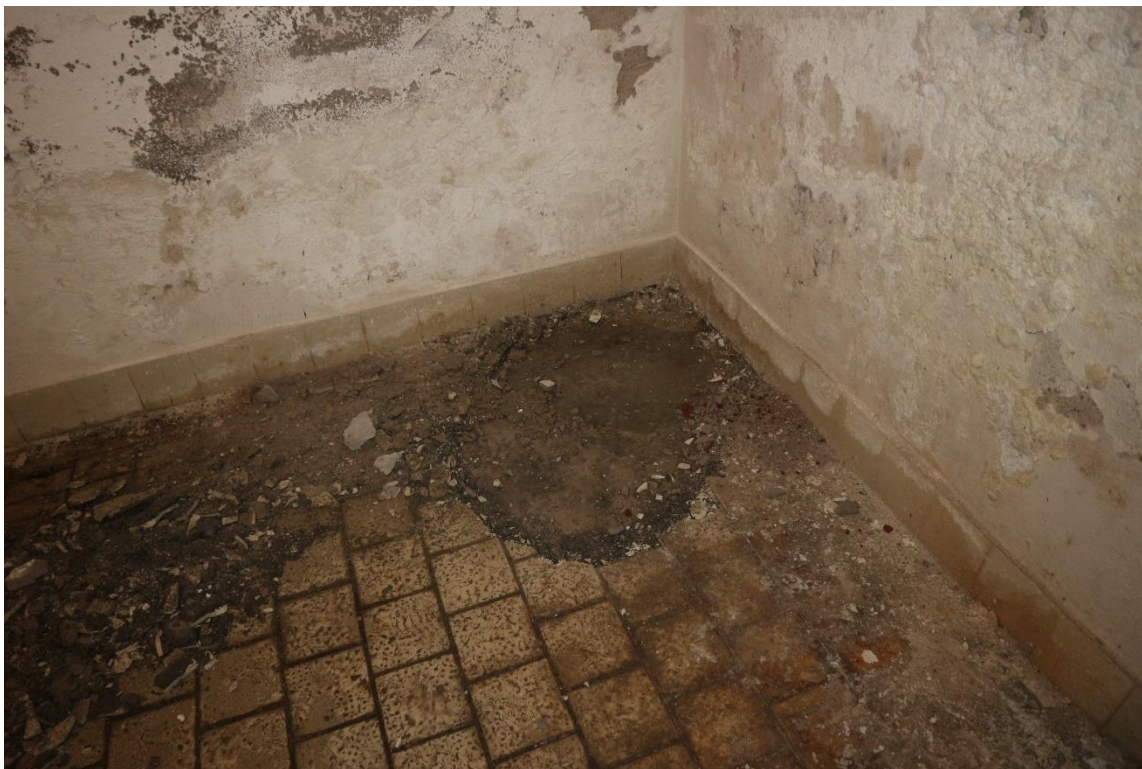
7...zátek v podlaze 1.PP.