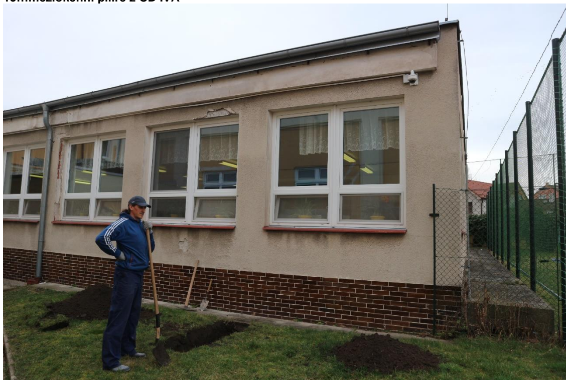
14...JZ nároží se sondou V1 v nepodsklepené části – betonový chodník u jižní fasády byl patrně součástí původního bazénu