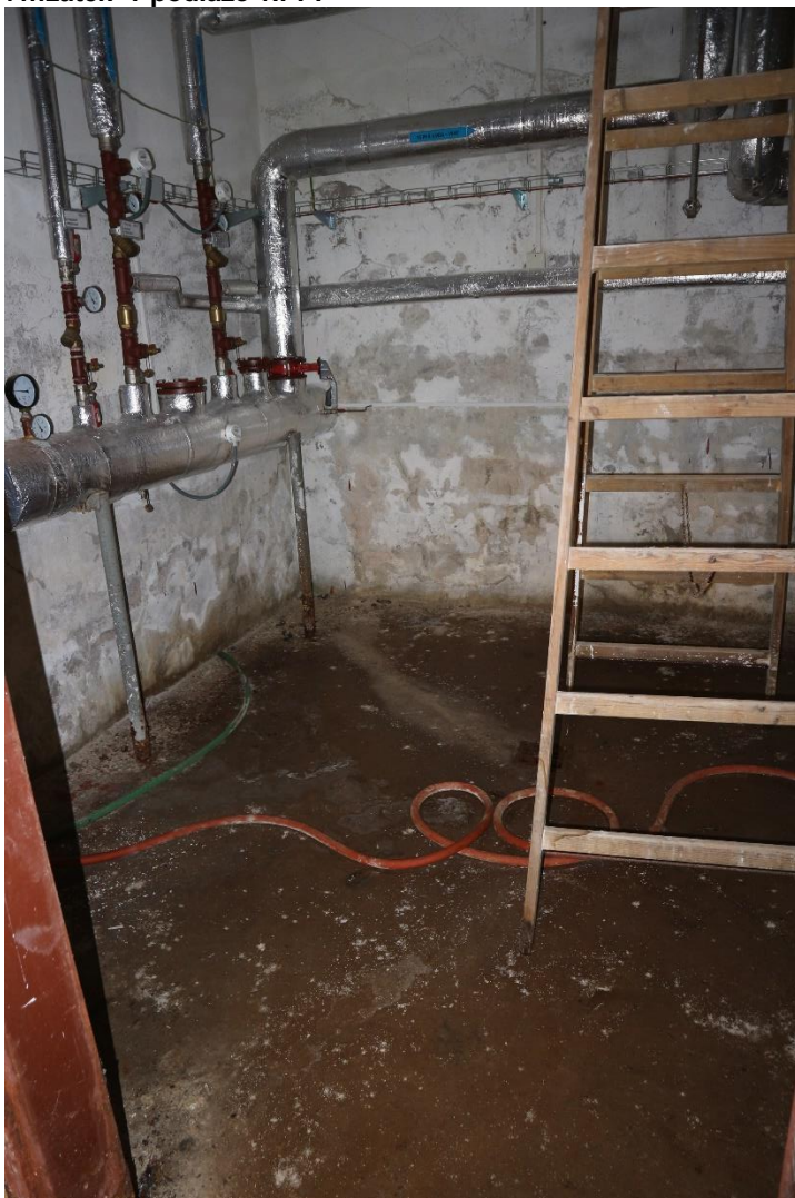
8...zatopená podlaha v 1.PP.