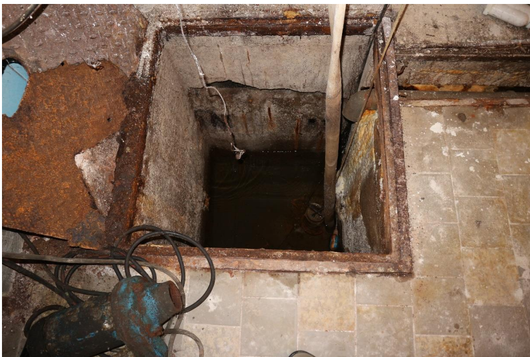
9...vsakovací jímka v 1.PP. s hladinou podzemní vody