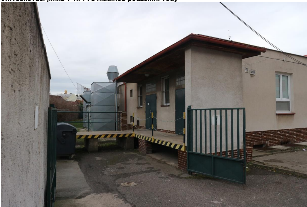
10...SV nároží 1.NP.