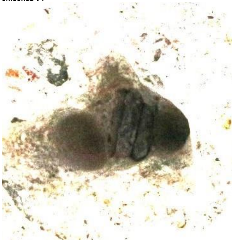
6...sonda V4 – detail předpínacího lana