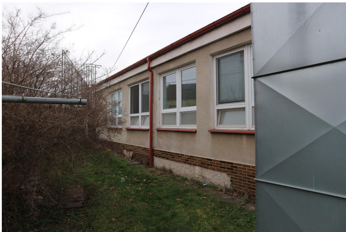
11...východní fasáda 1.NP.