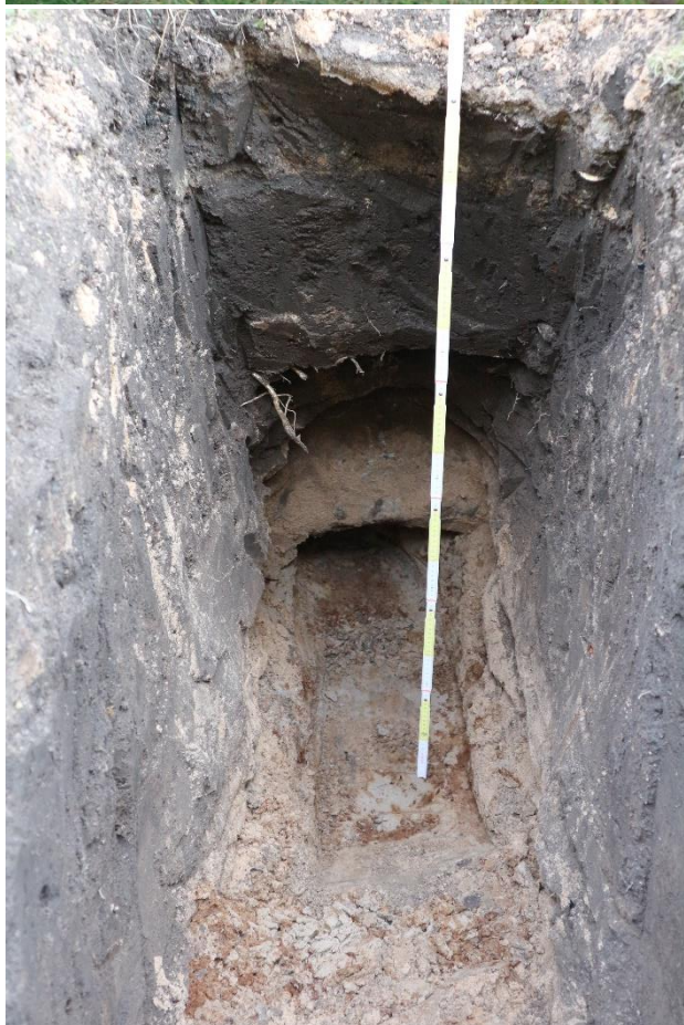
2...Sonda V2 detail