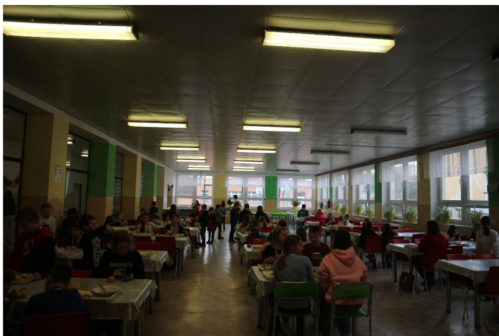
18...Jídelna v 1. NP. s patrnými sloupky zděnými z CD IVA