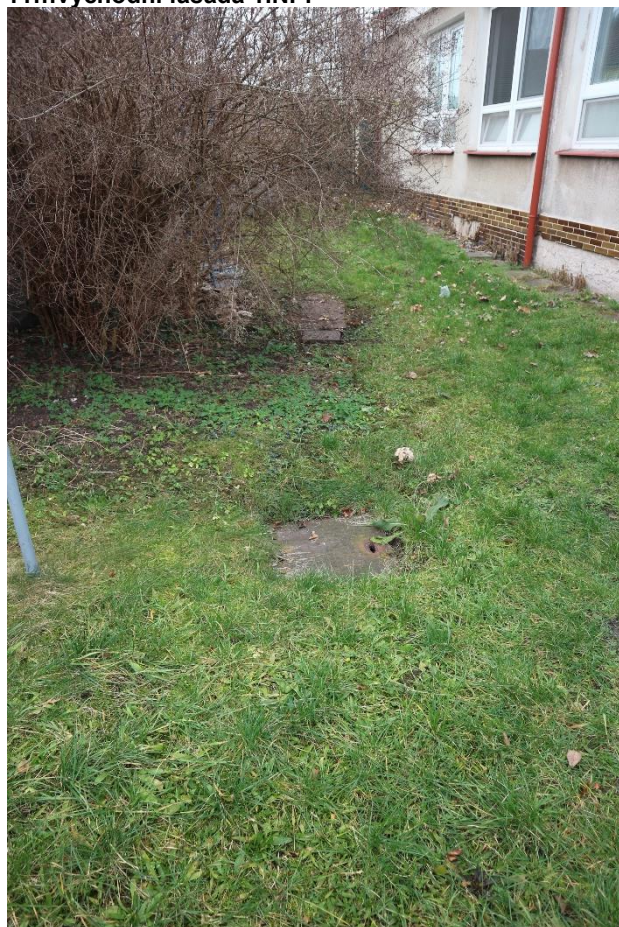
12... střešní svod a kanalizace u východní fasády – možný zdroj zatékání do 1.PP.